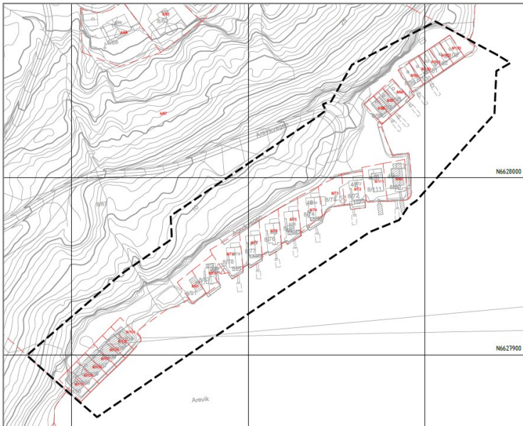
Figur 3 Utsnitt planavgrensning