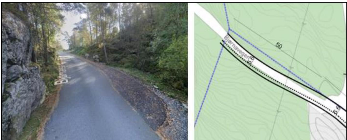
Figur 2 Utsnitt frå Google Street View og skisse. Dei første 50 metrane er allereie opparbeidd med ei breidde på 5,6 meter. Stipla line syner gangareal.

Bjørnavegen har i dag varierende breidde og er om lag 3,5 meter på det smalaste. Det er gjort ei utviding av vegen på ei strekning på 50 meter. Breidda for dette stykket er no totalt 5,6 meter.