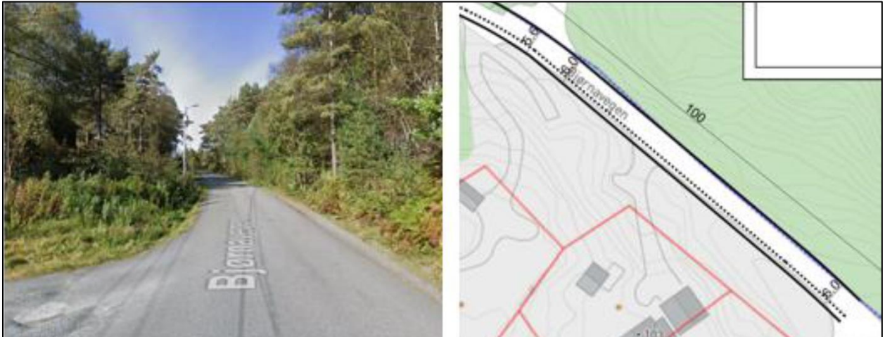
Figur 3 Utsnitt frå Google Street View sett mot nordvest, og utsnitt frå skisse.

I skisse for ny løysing har ein tatt utgangspunkt i allereie opparbeidd utviding. For dei fyrste 70 metrane har vegen ei totalbreidd på 5,6 meter. Dei neste 80 metrane har ein i hovudsak lagt utvidinga på vestsida av vegen og halde på eksisterande vegkant på austsida. På dette strekket har ein lagt inn forslag om ein totalbreidd på 6 meter.