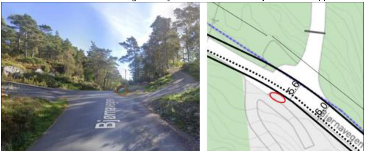
Figur 5 Utsnitt frå Google Street View og skisse. Skålgropsteinen er markert med raud ring.

På bakketoppen ligg det ein skålgropstein frå bronsealder som er automatisk freda. For å unngå å kome i konflikt med steinen er vegen difor justert mot nord før ein kjem til bakketoppen.