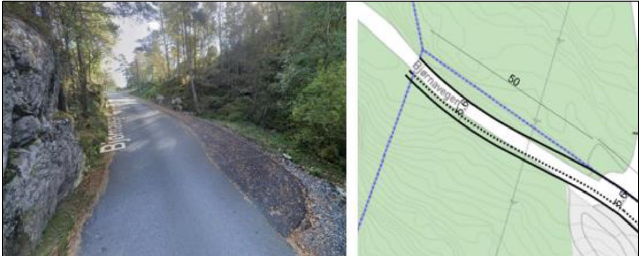
Figur 2 og 2 Utsnitt frå Google Street View og skisse. Dei første 50 metrane er allereie opparbeidd med ei breidde på 5,6 meter. Stipla line syner gangareal.

Bjørnavegen har i dag varierende breidde og er om lag 3,5 meter på det smalaste. Det er gjort ei utviding av vegen på ei strekning på 50 meter. Breidda for dette stykket er no totalt 5,6 meter.