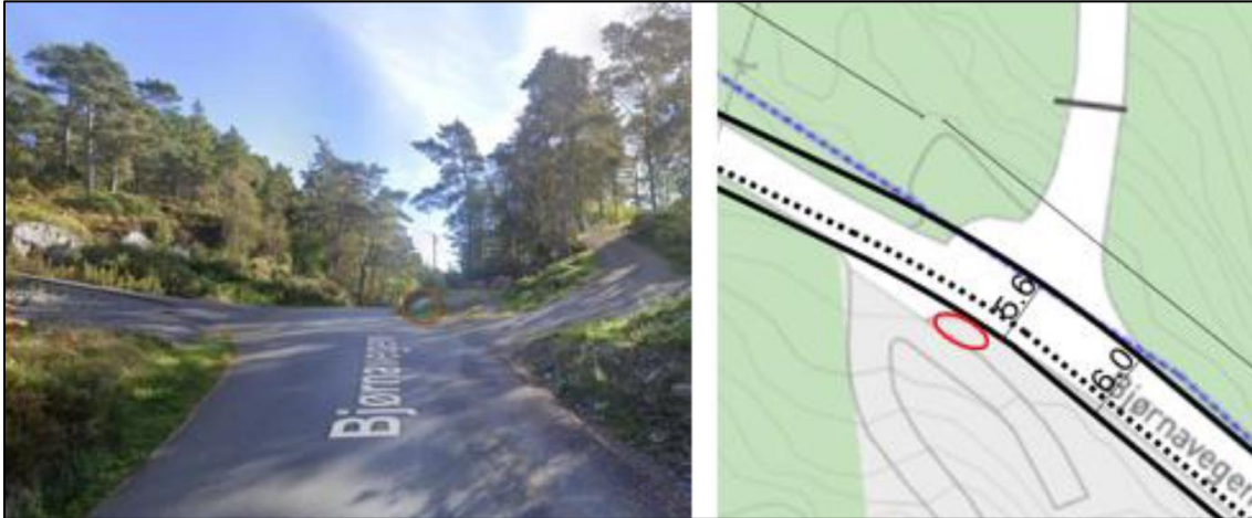
Figur 5 og 6: Utsnitt frå Google Street View og skisse. Skålgropsteinen er markert med raud ring.

På bakketoppen ligg det ein skålgropstein frå bronsealder som er automatisk freda. For å unngå å kome i konflikt med steinen er vegen difor justert mot nord før ein kjem til bakketoppen.